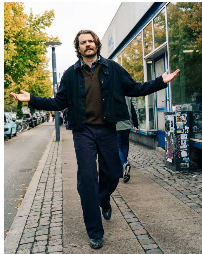
I 3. klasse blev Pilou hængt ud for sin ordblindhed af sin dansk lærer. Det resulterede i, at han så godt som aldrig skrev noget i hånden siden. Når han fx er til Comic Cons, har han indøvet standardsætninger til fans, der efterspørger autografer og hilsner.

"Det er, fordi jeg ikke kan være andre end mig selv. Jeg kan ikke ændre min personlighed. Jeg bliver nødt til at insistere på at være mig selv i offentligheden og ikke opfinde en offentlig karakter, for det bliver jeg sindssyg af," sagde han.