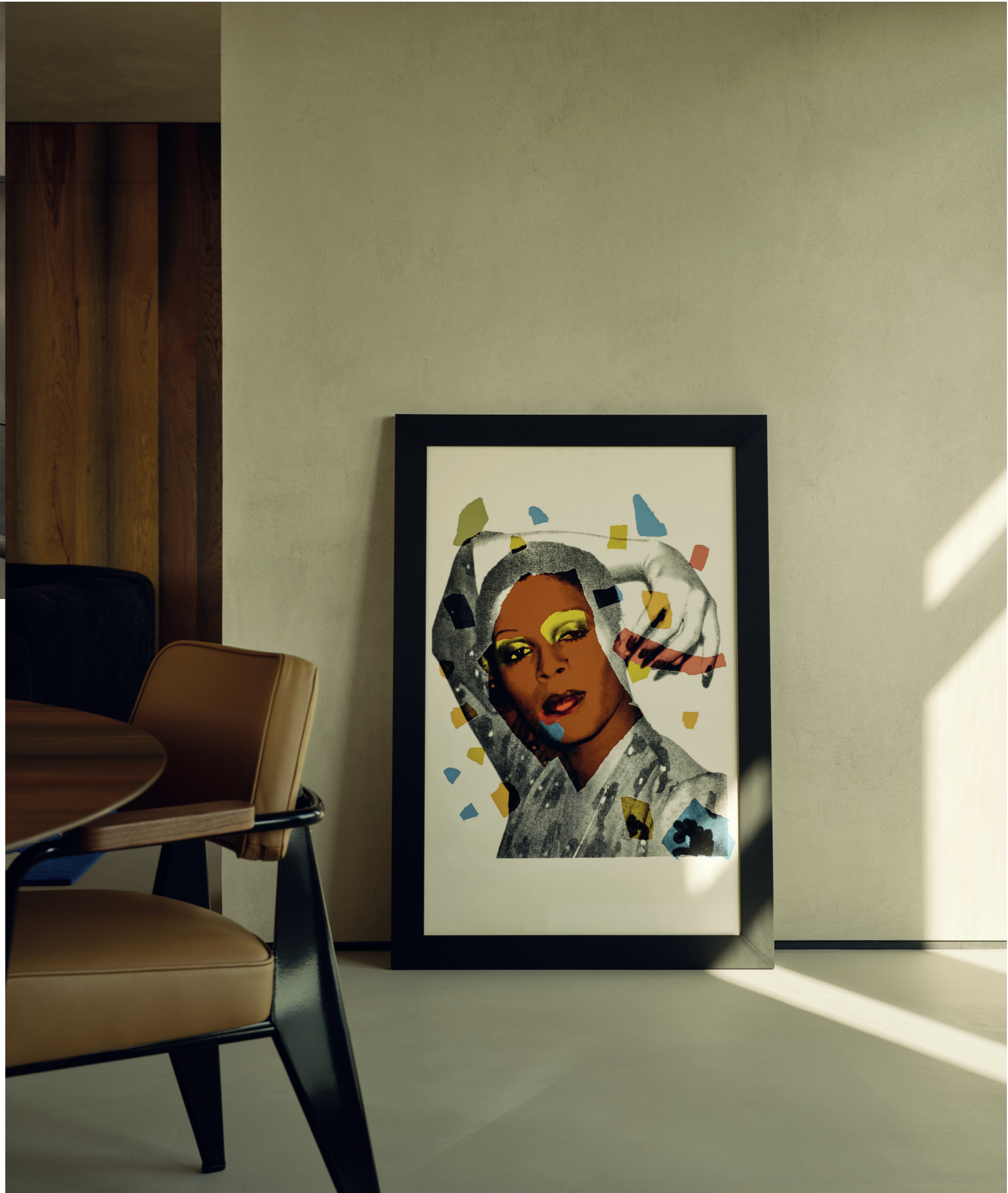
SOPRA La cucina in acciaio custom made. A SINISTRA Poltroncina in resina di Gaetano Pesce per Bottega Veneta. PAGINA ACCANTO Serigrafia di Andy Warhol della serie Ladies & Gentlemen , Fauteuil Direction di Jean Prouvé per Vitra.