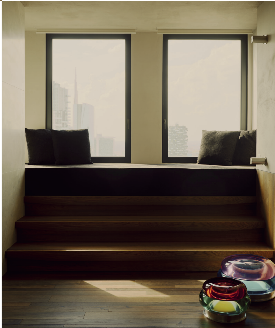
SOPRA E A SINISTRA Il bagno con rivestimento e dettagli in marmo bianco che proviene da una cava sull'oceano che si trova in Patagonia. A DESTRA Lampade da terra Bon Bon di Draga & Aurel (Nilufar). PAGINE SUCCESSIVE, A DESTRA Tappeto di Bratislav Tasic e Marcelo Burlon per Illulian, coperta in lana di Marcelo Burlon per County of Milan Homeware, divano e tavolo Giorgia Longoni Studio.